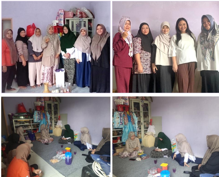
Gambar 2. Kegiatan Pengabdian Kepada Masyarakat