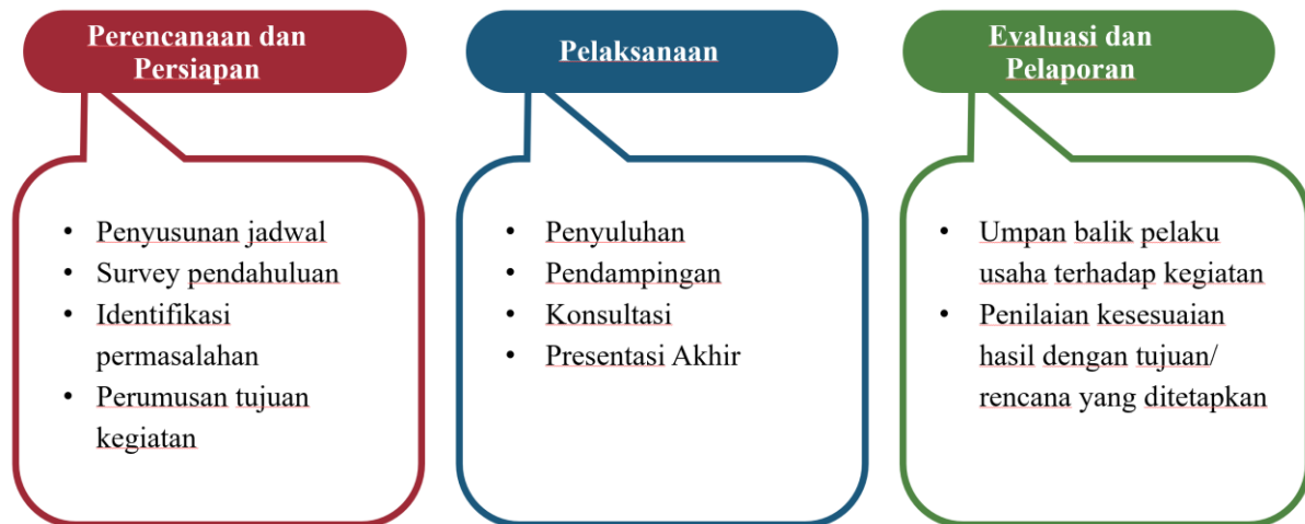
Gambar 1. Metode Pelaksanaan Kegiatan

Pelaksanaan kegiatan pengabdian masyarakat dilakukan melalui beberapa tahapan utama yang dilakukan dalam jangka waktu enam bulan, yaitu tahap perencanaan dan persiapan, tahap pelaksanaan dan tahap evaluasi dan pelaporan seperti yang terlihat pada Gambar 1 berikut ini.