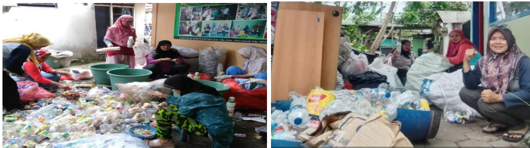
Gambar 3. Kegiatan Pemilahan Sampah

Pemilahan sampah memberikan berbagai manfaat yang dirasakan langsung oleh masyarakat. Dari aspek lingkungan, kegiatan ini membantu mengurangi volume sampah yang dibuang ke Tempat Pembuangan Akhir (TPA) dan menekan risiko pencemaran tanah, air, serta udara. Dari sisi ekonomi, peserta mulai memahami bahwa sampah anorganik seperti plastik, kertas, dan logam memiliki nilai jual yang dapat dimanfaatkan untuk meningkatkan pendapatan melalui program bank sampah. Sedangkan dari aspek sosial, kegiatan ini menumbuhkan kesadaran kolektif dan semangat gotong royong dalam menjaga kebersihan lingkungan.