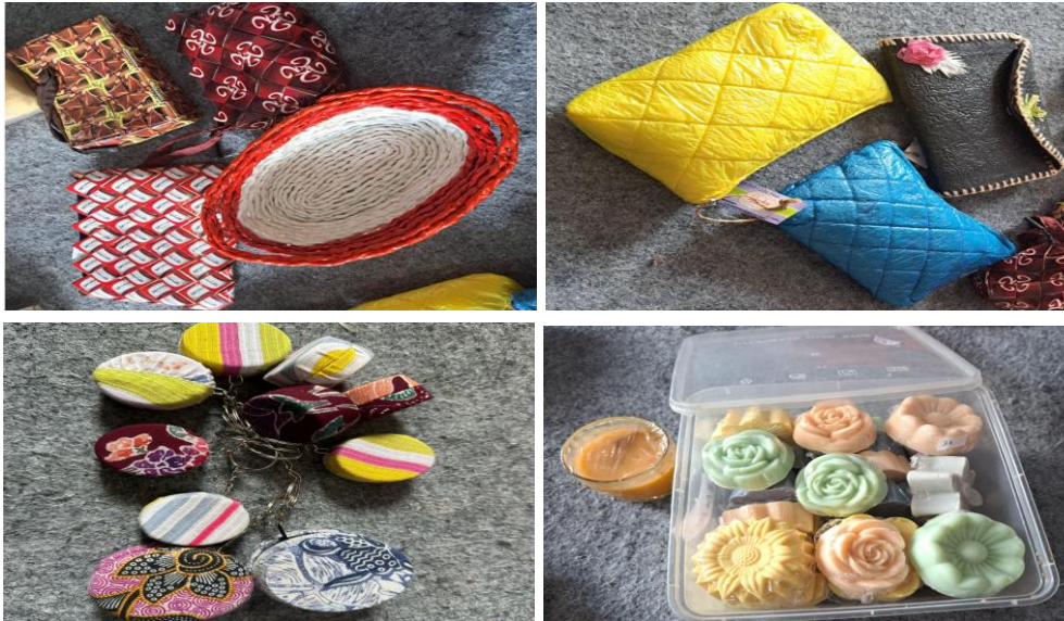
Gambar 4. Beberapa Produk Hasil Pengelolaan Sampah

peningkatan kualitas produk melalui pelatihan keterampilan bagi pengelola dan warga, seperti teknik pengolahan plastik, pembuatan kompos berkualitas, atau pengembangan kerajinan bernilai jual tinggi. Selain itu, inovasi desain dan diversifikasi produk perlu dilakukan agar hasil olahan memiliki daya tarik dan fungsi yang lebih luas di pasaran.