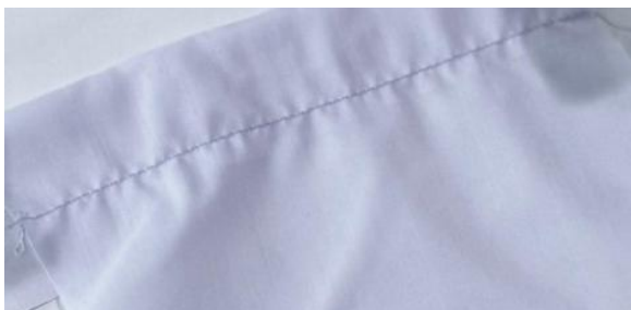
Gambar 1. Contoh Sampel Pengamatan

melakukan pemeriksajaa, Kain yang digunakan adalah kain dengan anyaman keeper atau twill dengan jenis benang yang berbeda warna dibandingkan warna kain. Sampel cacat jahitan yang digunakan berupa gambar atau foto. Sampel cacat dapat berasal dari pembuatan saku kemeja dan berasal dari internet. Contoh gambar sampel yang diperiksa dapat dilihat pada Gambar 1. Jenis cacat yang diteliti adalah broken stitch , puckering dan skip stitch .